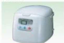
電気炊飯ジャー1升 ※その他、玉合数あり。4.4kgです。