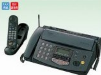
ファクシミリ(家庭用)