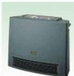
セラミックファンヒーター 適室:0~2坪