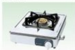
ガスコンロ1口(LPG-都市ガス)