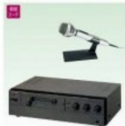
放送アンプ[マイク付]