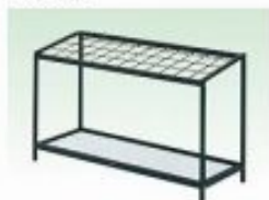
傘立て〔24人用〕 傘立て〔48人用〕