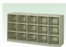
スクールロッカー15人用