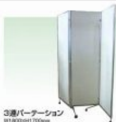
3連パーテーション W1100×H1700mm