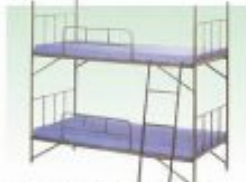
スチールベッドマット付1段・2段 W11810×D9110×H800mm