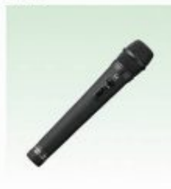
ワイヤレスマイク