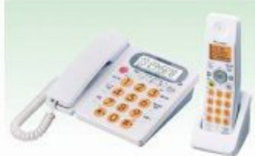
コードレス留守番電話