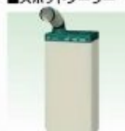
スポットクーラー