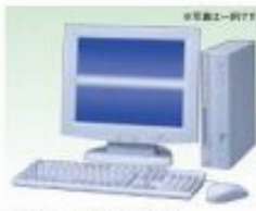
デスクトップ型パソコン モニター(CRT、液晶、15インチ)

別売商品 アイコン表示商品については、料金が別途お見積りいたします。 トナー カートリッジ