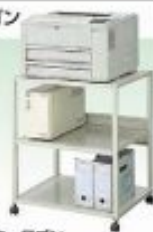
プリンターワゴン W600×D500×H725mm