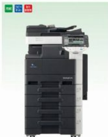
デジタルコピー カラーコピー-FAX/プリンター-スキャナー-ネットワーク対応 25枚複写 / 全