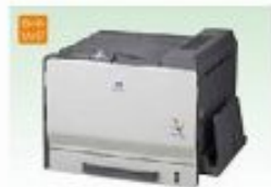
カラーレーザープリンター 25枚巻/分 USB・ネットワーク対応