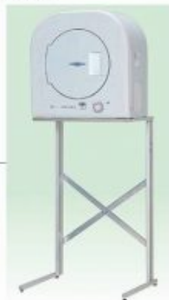
乾燥機[スタンド付]4.5Kg