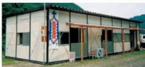
ハウス 1F 2F×7.5F