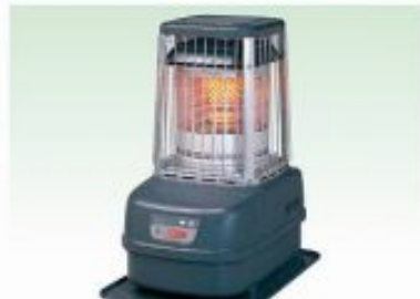
ブルーヒーター [大] 適室:10~25坪