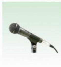
ワイヤードマイク