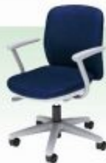
布張り肘付回転椅子 W545×D535mm