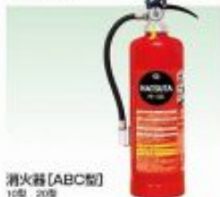
消火器〔ABC型〕 10型 20缶