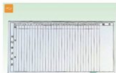
壁掛けタイプ ホワイトボード行事 2×3 H600×W900mm 3×4 H900×W1200mm 3×6 H900×W1800mm