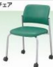
面談椅子キャスター付 W510×D500×H420mm