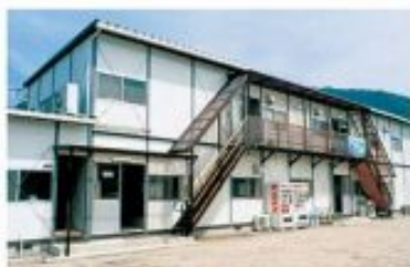
ハウス 2F 2F 4F×12F/1F 2F 4F×14F