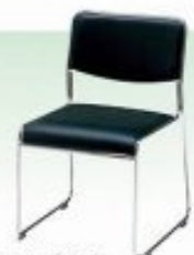
ミーティングチェア W450×D500×H420mm