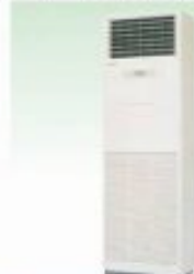
床置きエアコン[冷暖]