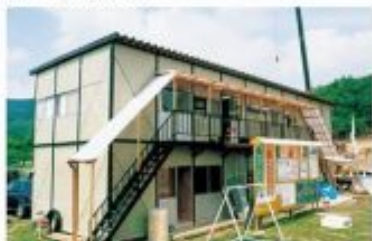
ハウス 2F 2F×10F