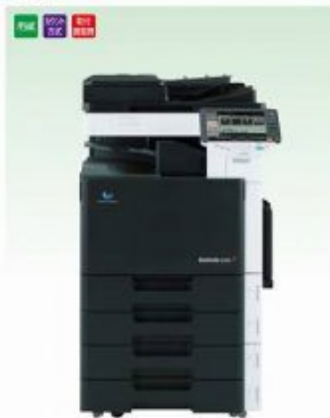
デジタルカラーコピー エラーコピー-FAX/プリンター-スキャナー-ネットワーク対応 25枚複写 / 全 カラーコピー-FAX/プリンター-スキャナー-ネットワーク対応 45枚複写 / 全