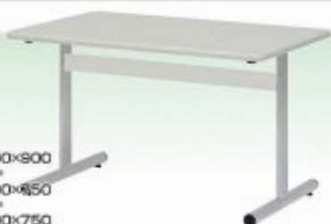
面談テーブル1800×900 W1800×D900×H700mm 面談テーブル1500×幅50 W1500×D750×H700mm 面談テーブル1200×750 W1200×D750×H700mm