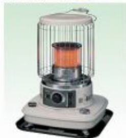
対流ストーブ 適室:3~6坪