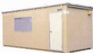
単棟ユニットハウス W3400×L5400mm