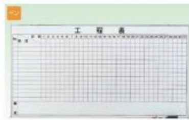
壁掛けタイプ 工程ホワイトボード3×6 H900×W1800mm