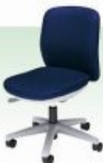
布張り肘無回転椅子 W445×D535mm