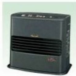
ファンヒーター 適室:0~2坪