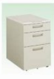
HG-ワゴン(キャスター付) W400×D600×H610mm