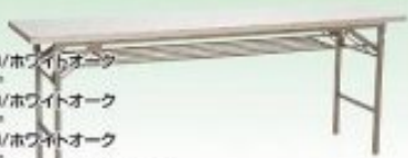
会議テーブル450/ホワイトオーク W1800×D450×H700mm 会議テーブル600/ホワイトオーク W1800×D600×H700mm 会議テーブル900/ホワイトオーク W1800×D900×H700mm 会議テーブル450×1200/ホワイトオーク W1200×D450×H700mm 会議テーブル450×1500/ホワイトオーク W1500×D450×H700mm