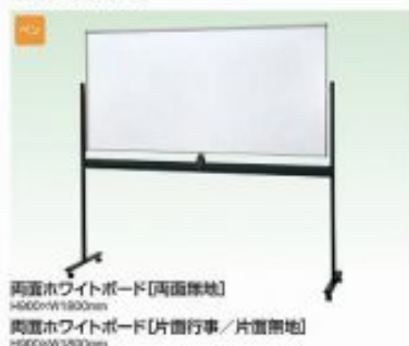
両面ホワイトボード〔両面緑地〕 H600×W1800mm 両面ホワイトボード〔片面行事／片面緑地〕 H600×W1800mm