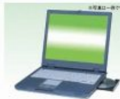
ノート型パソコン