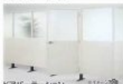
ドアパーテーション W1900×H1900mm パーテーション W1900×H1900mm