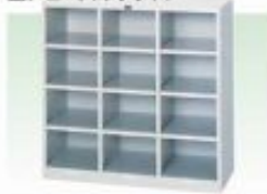
シューズボックス