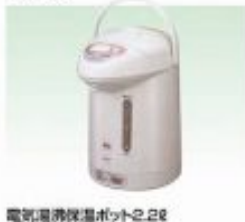
電気湯沸保温ポット2.2ℓ