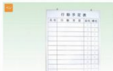
壁掛けタイプ 行動予定表 H600×W600mm