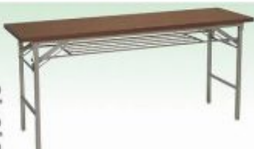
会議テーブル450 W1800×D450×H700mm W1500×D450×H700mm 会議テーブル600 W1800×D600×H700mm 会議テーブル900 W1800×D900×H700mm