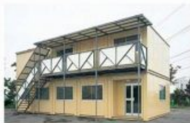
連棟ユニットハウス 2連棟2階建て