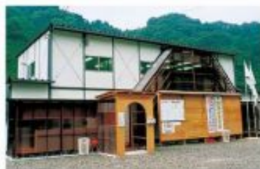
ハウス 2F 2F 4F×8F/2F 2F 4F×11F