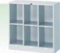
シューズボックス6人用 (長靴入れ)