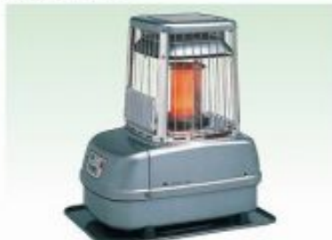
ブルーヒーター [小] 適室:4~11坪