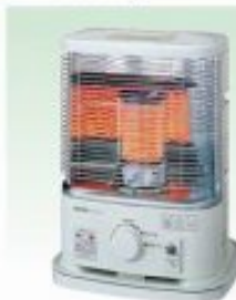
反射ストーブ 適室:3~6坪