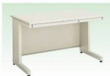
HG-平机 W1000×D700×H700mm W1200×D700×H700mm W1400×D700×H700mm