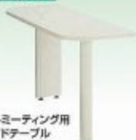
HGミーティング用 サイドテーブル W120×D450×H700mm