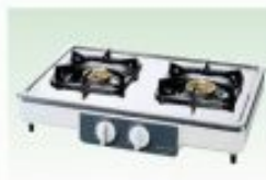
ガスコンロ2口(LPG-都市ガス) ガスコンロ2口 グリル付き(LPG用)