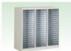
トレーキャビネットA4