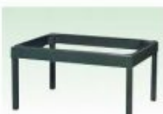
マップケース[A1-S]用スタンド W970×D730×H507mm

別途 送料 別注 取付調整費 FAX 用紙 アイコン表示機器にのみ対応。対応機種は別途お問い合わせください。 ※写真とは異なる場合があります。